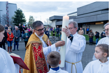
Feier der Osternacht