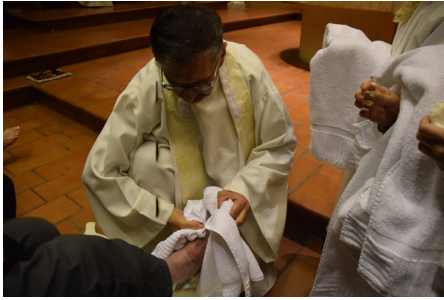
Fußwaschung am Gründonnerstag