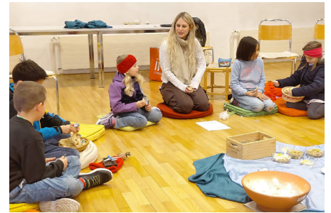
Abendmahlfeier für Kinder