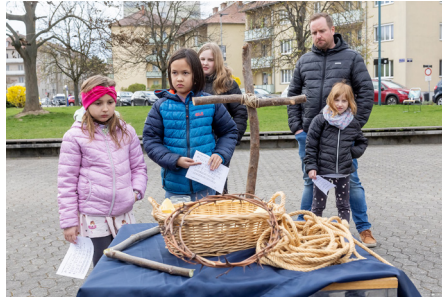
Kreuzweg für Kinder